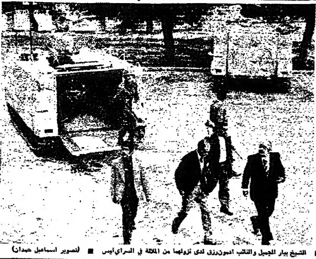
الشيخ بيار الجميل والقائد آمون رزيق لدى زيارتهما من الملكة في السراي ايس